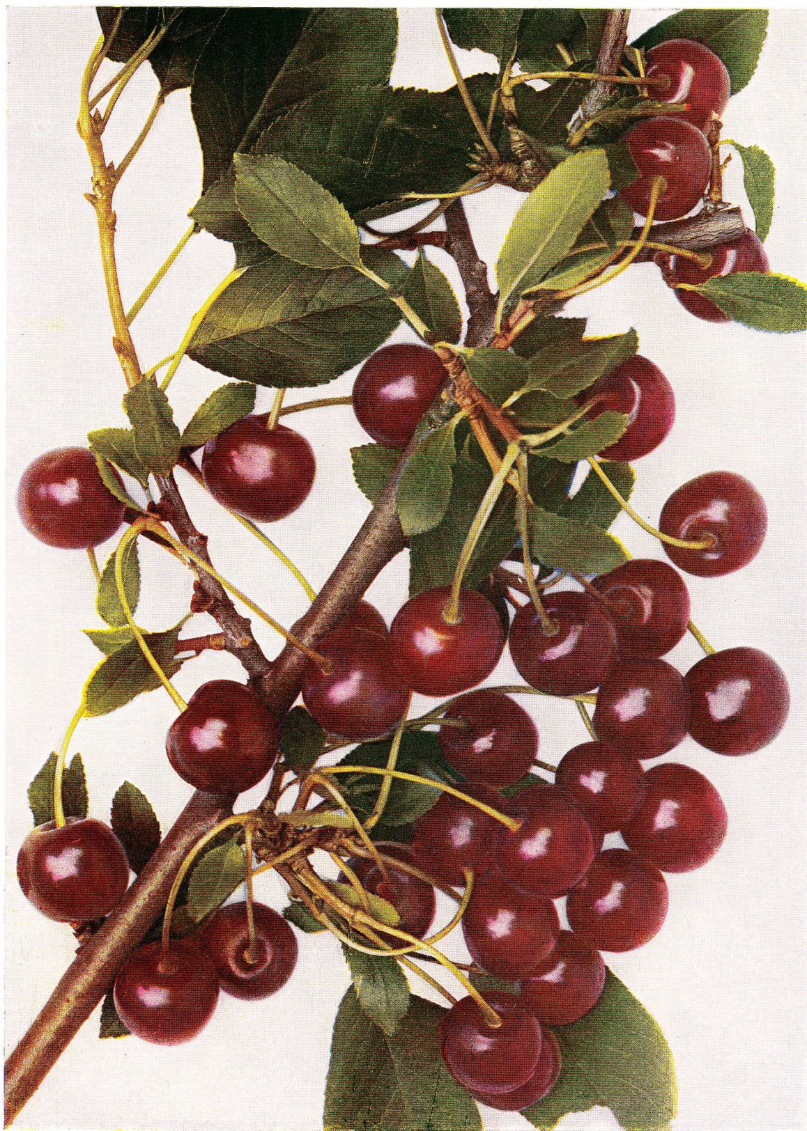
BRUSSELSKÁ HNĚDÁ – Brüsseler braune. – Brune de Bruxelles.