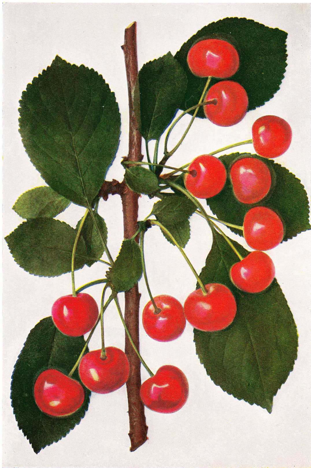
CHATENAYSKÁ – Chatenay's schöne. – Belle de Chatenay.