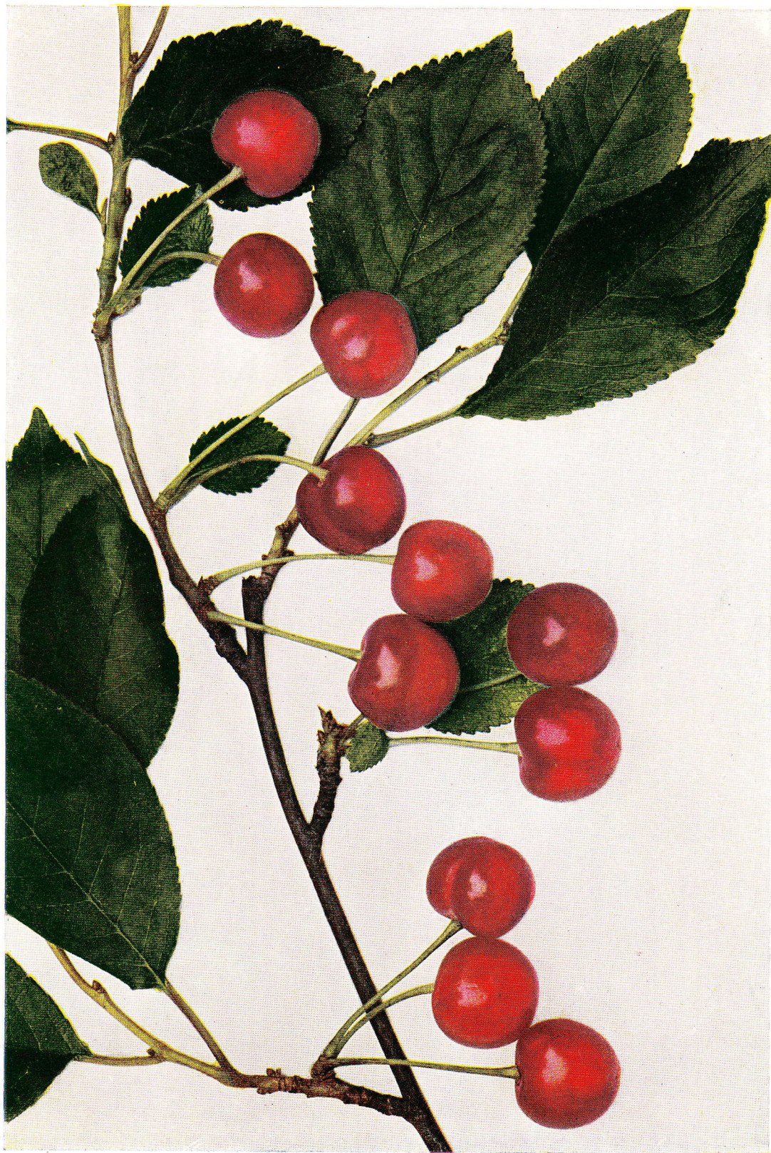
OSTHEIMSKÁ VIŠEŇ - Ostheimer Weichsel . - Griotte d'Ostheim .