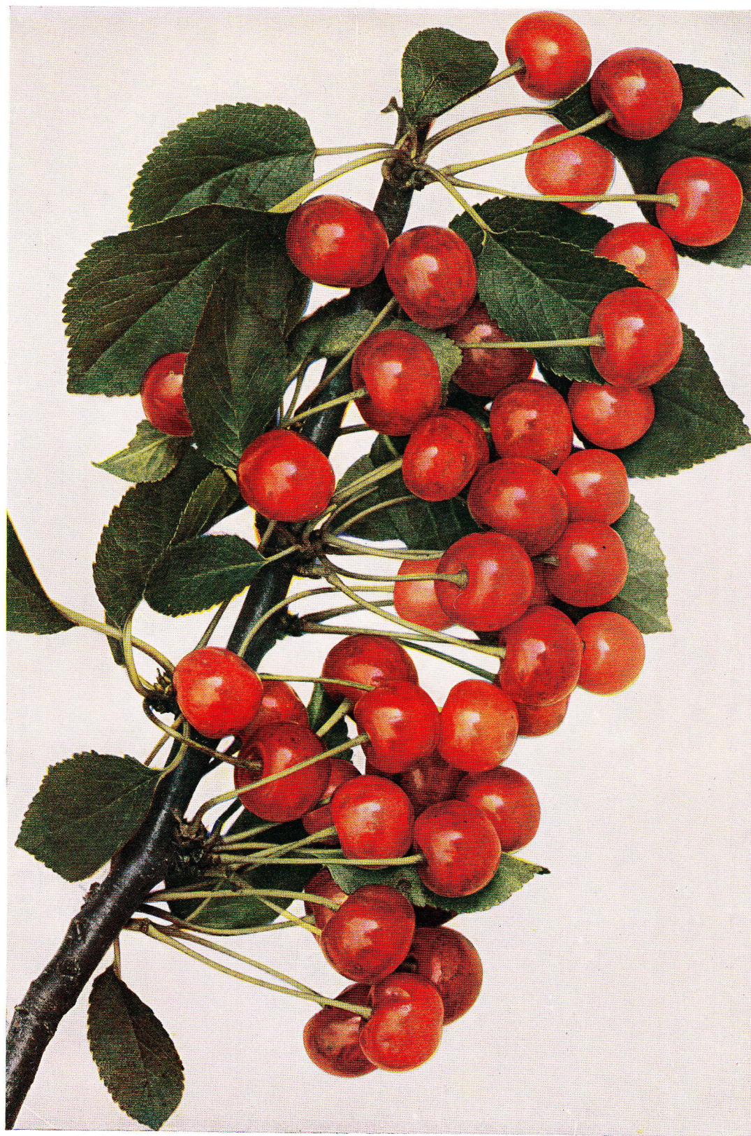
AMARELKA KRÁLOVSKÁ – Königliche Amarelle . – Amarelle royale hâtive .