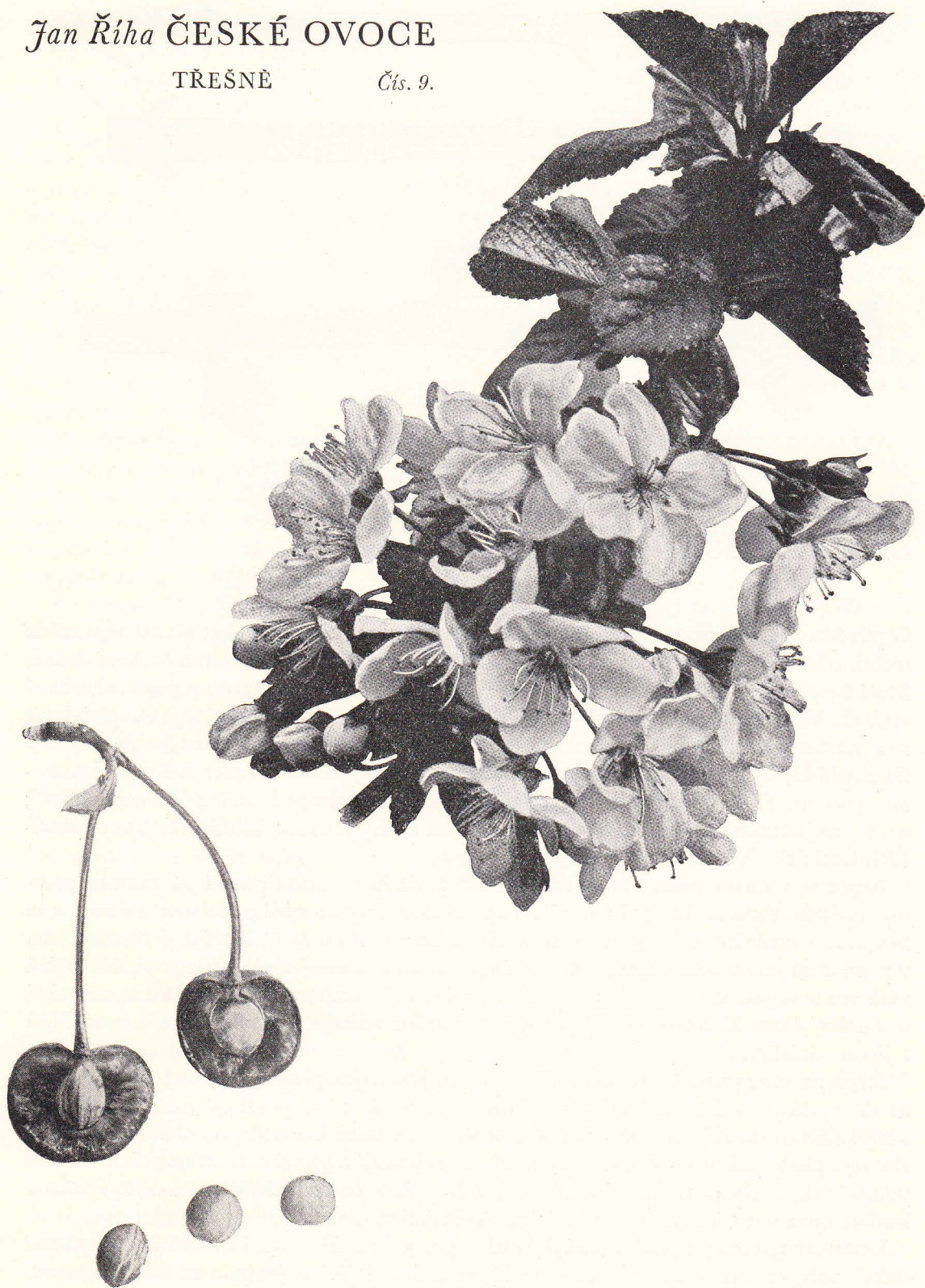
SLADKOVIŠEŇ RANÁ – Rote Maikirsche – May Duke