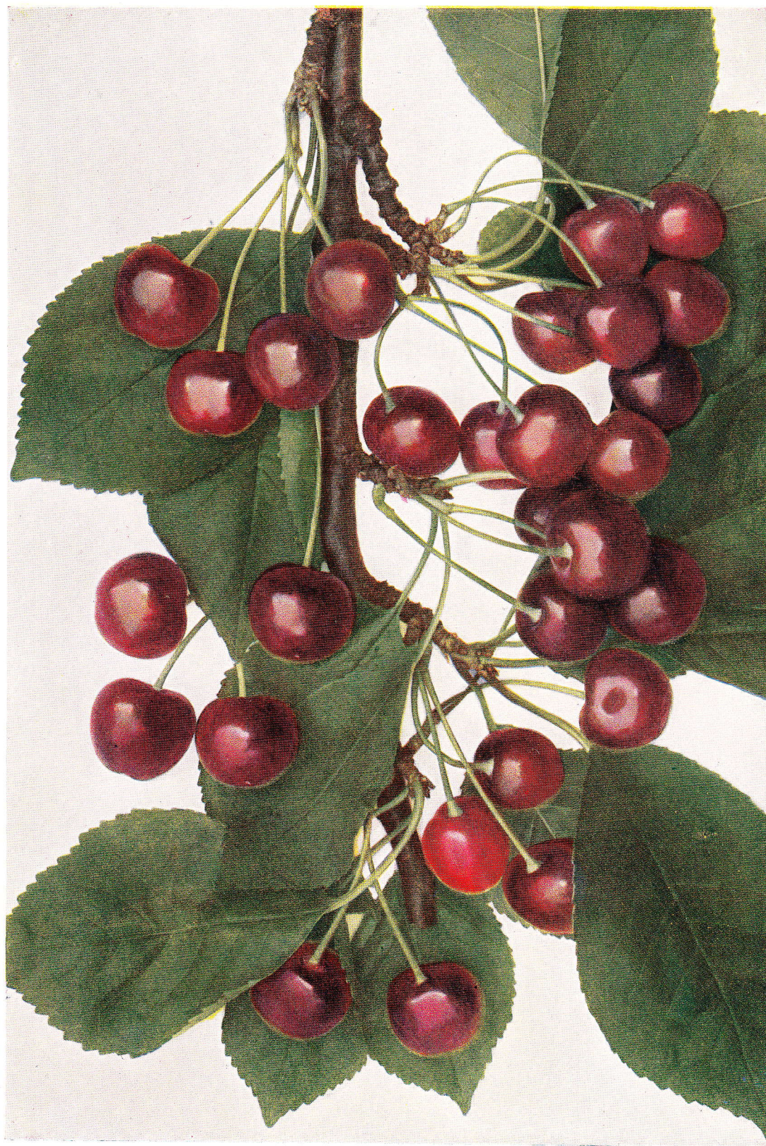
SLADKOVIŠEŇ RANÁ – Rote Maikirsche. – May Duke.