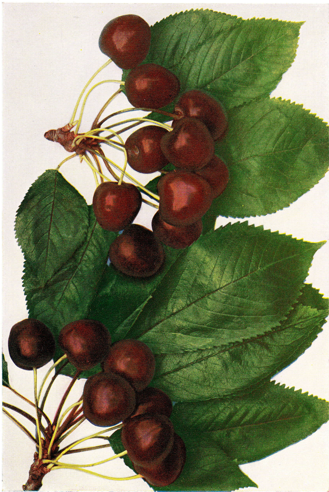
HEDELFIŇSKÁ— Hedelfinger Riesenkirsche. — Bigarreau d'Hedelfingen.