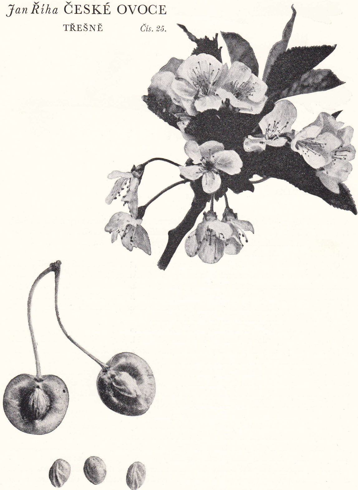
HEDELFIŇSKÁ — Hedelfinger Riesenkirsche — Bigarreau d' Hedelfingen