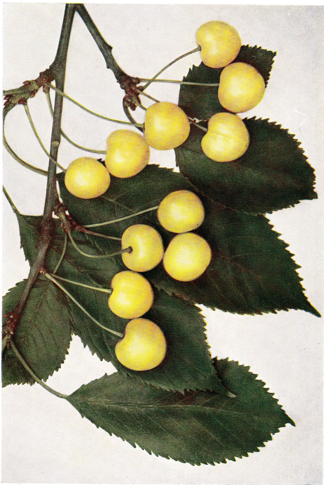
DÖNISSENOVA ŽLUTÁ – Dönnissen's gelbe Knorpelkirsche. – Bigarreau Doenissen.