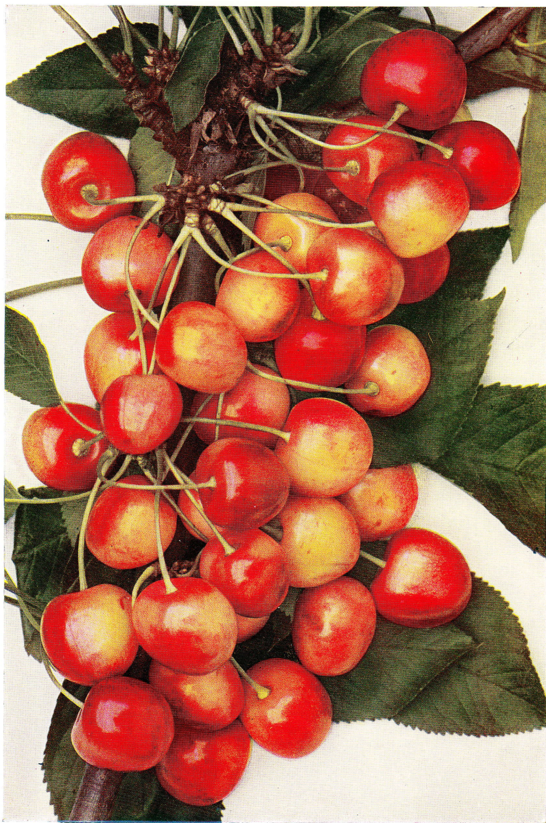
BALTAVANSKÁ - Baltawaner .