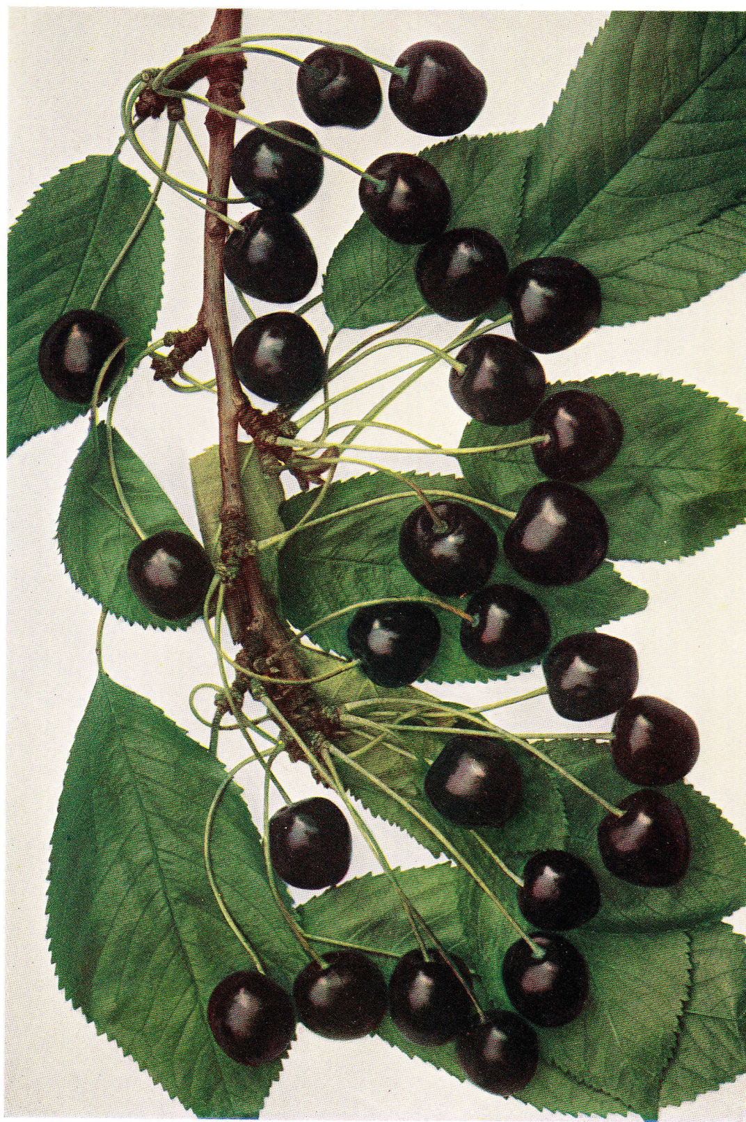
KOBURSKÁ RANÁ – Koburger Maiherzkirsche . – Guigne précoce de Coburg .