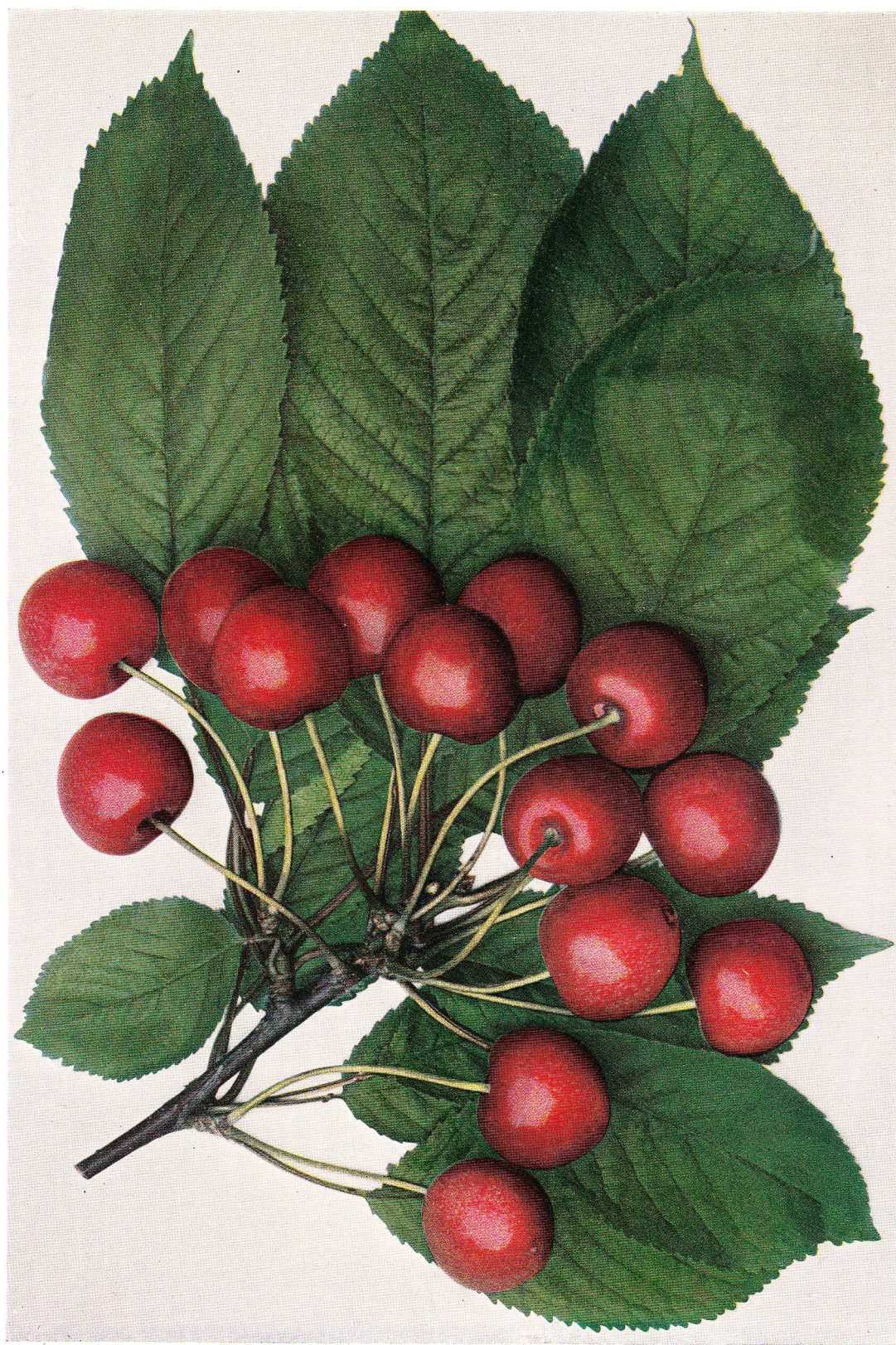
BOPPARĎSKÁ RANÁ – Frühe von Bopparď.