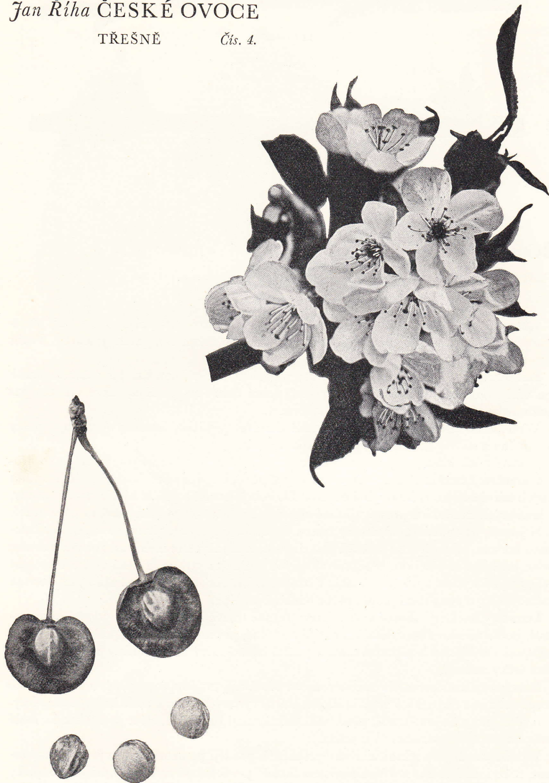
BOPPARDSKÁ RANÁ – Frühe von Boppard