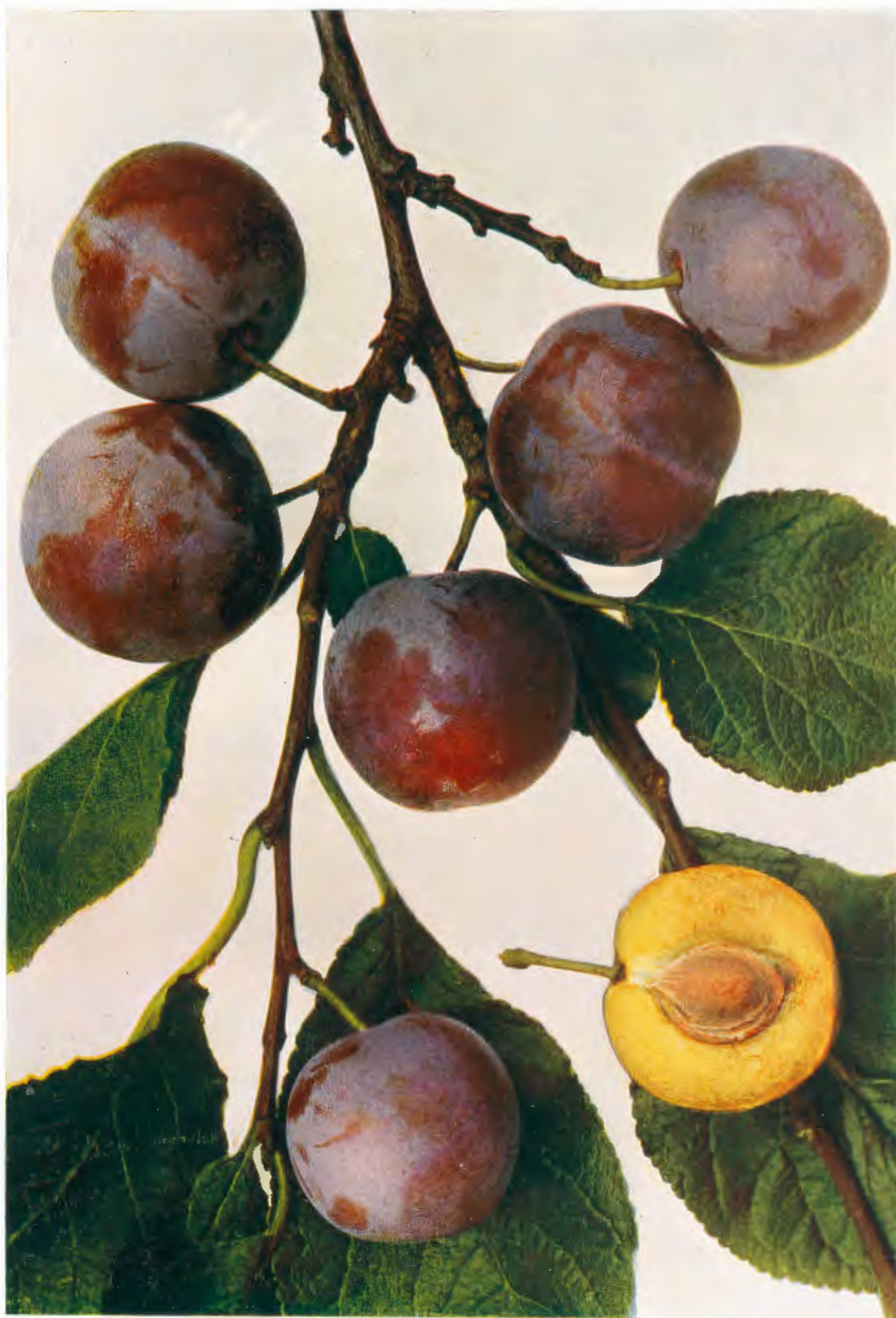
ALTHANOVA RENCLOTA – Althann's Reine-Claude. – Reine-Claude comte d'Althan.