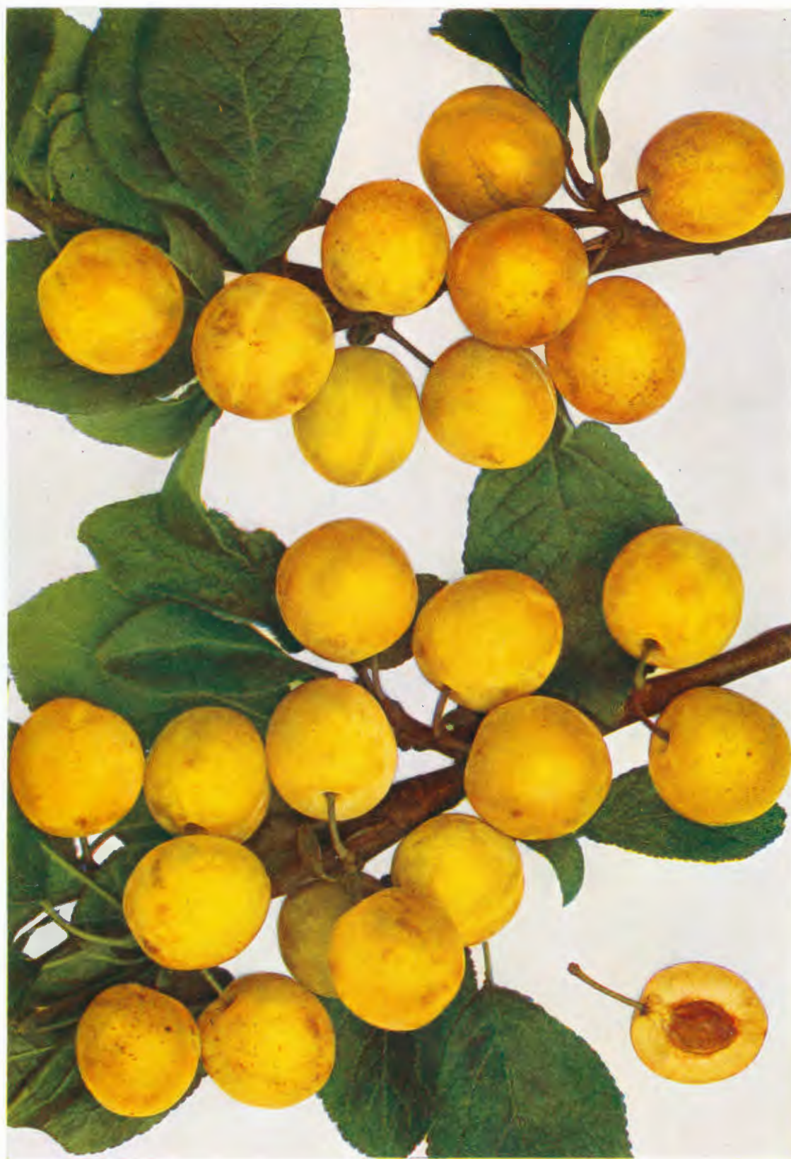
FLOTOVOVA MIRABELKA - Von Flotow's mirabelle. - Mirabelle de Flotow.