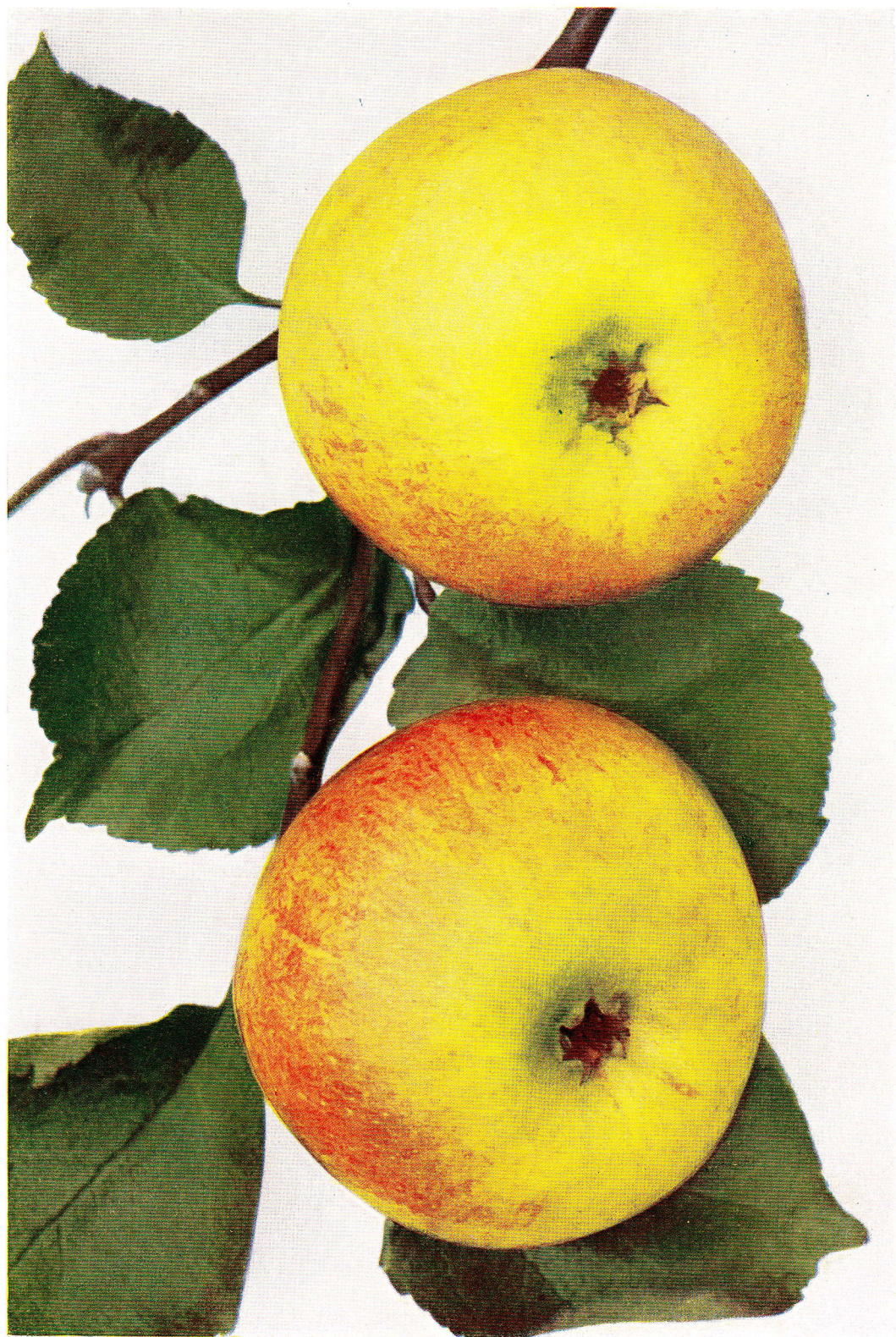
BLENHEIMSKÁ RENETA – Goldrenette von Blenheim. – Blenheim Pippin.