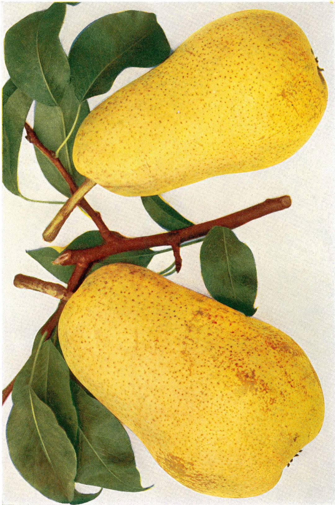
ŘÍHA, Jan. České ovoce I. Hrušky. 3. nezměněné vyd. Praha: Čsl. grafická unie, 1937. EZÉE-SKÁ – Gute von Ezée. – Bonne d'Ézée.