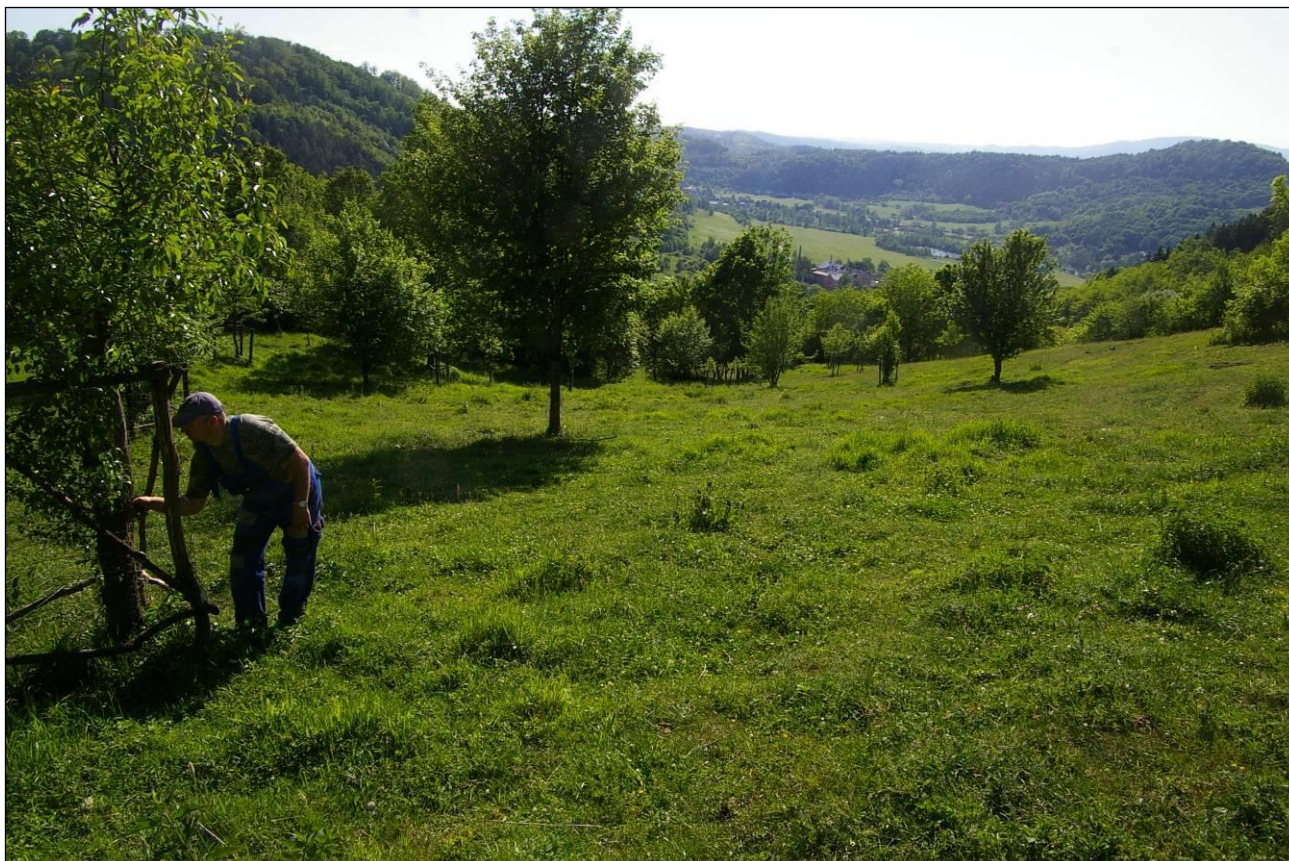
Při použití vzrostlých pláňat je také velmi důležité neustálé odstraňování podrůstání podnoží.